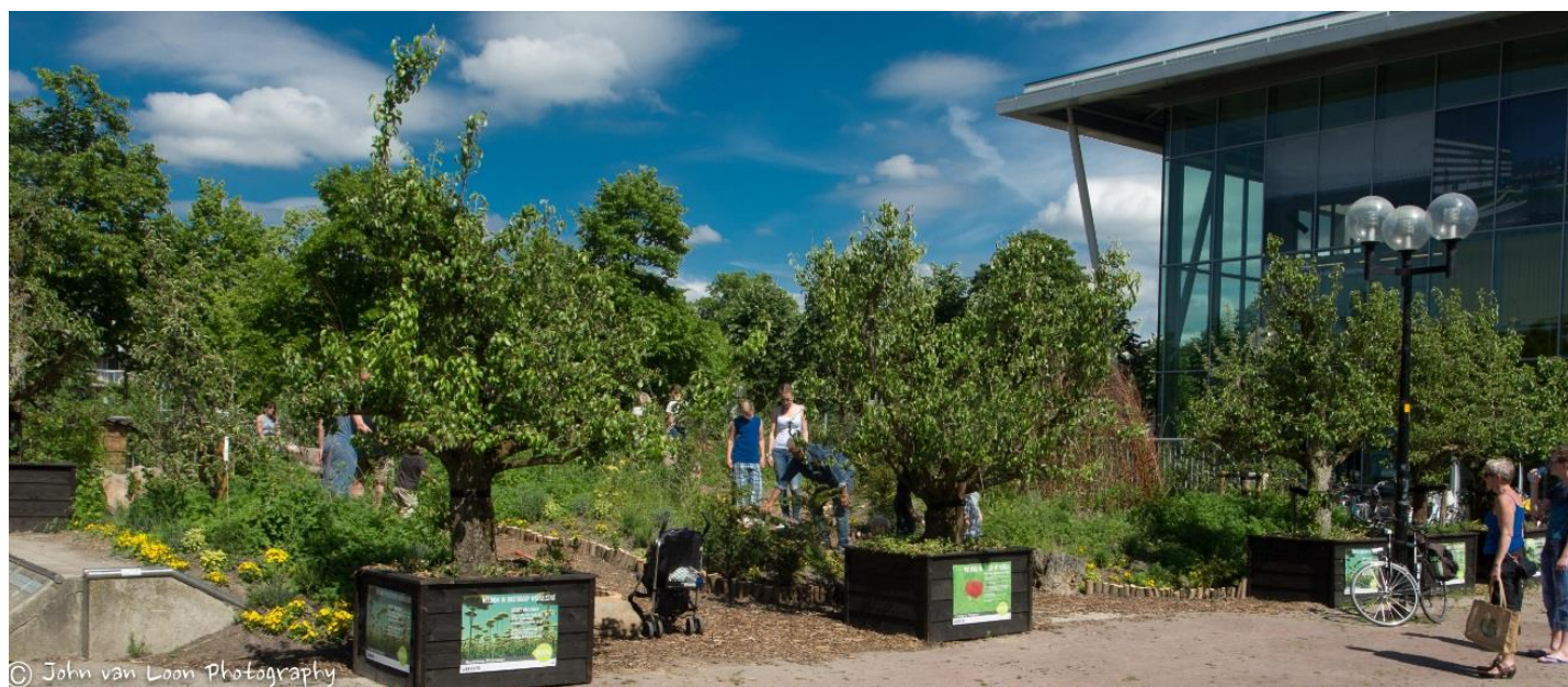
Het Pop-up Parkje op het Raashuisplein, Hoofddorp: de verrassing van 2017