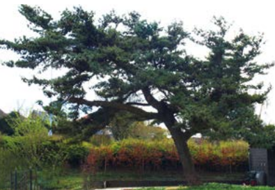
Oostenrijkse den, Segrina hoeve

11 Op de hoek Schouwstraat bij Aalsmeerderdijk 677 staat een eeuwoude plataan van 3.3 meter.