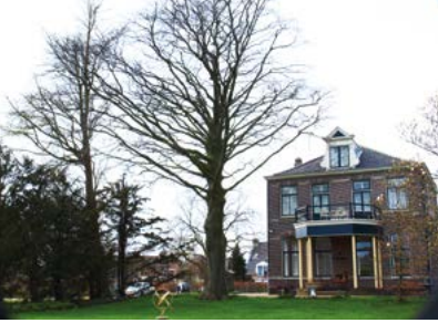
Rode beuk, Segrina hoeve