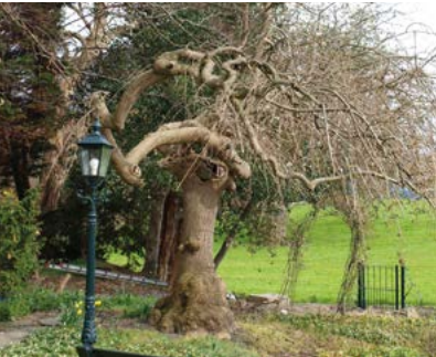
Treures, Segrina hoeve