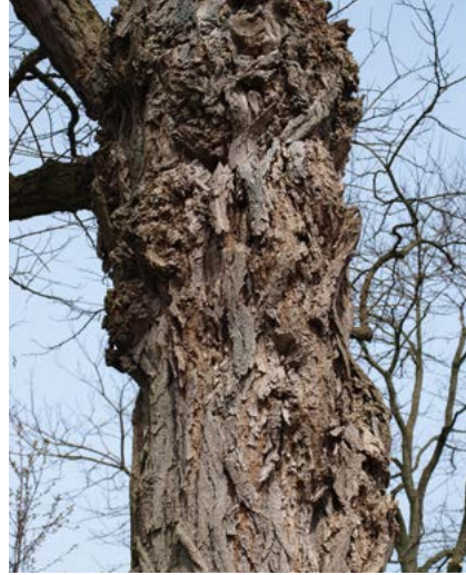
Diepe groeven in bast Robinia