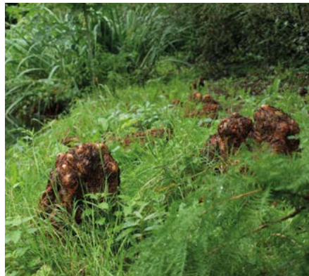
Kniewortels van moerascipres

16 Ook daar is een mooie verzameling van bomen: 5 Hollandse iepen, een Kaukasische vleugelnoot, 6 Spaanse aken en een moerascipres aan de overkant van de vijver. De moerascipres is een moerasboom met een speciale aanpassing aan het onder water staan.