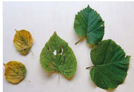
Foto: vlnr winterlinde, gewone linde, zomerlinde

vaak gebeurt), maar tot laag bij de grond buigen. De dikste winterlinde is 2 meter in omvang en zou volgens de bomenlijst van de gemeente 50 jaar oud zijn. Wij denken dat de lindes 70-80 jaar zijn, net als de andere bomen in deze wijk. De wijk dateert uit de jaren vijftig, tel de plantleeftijd erbij op.....