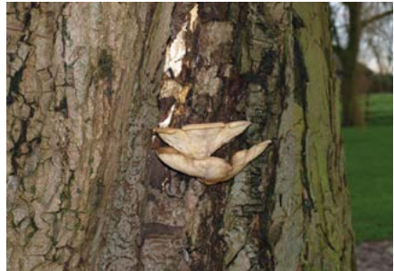
paddenstoel op kastanjeboom

5 Op het naastgelegen erf op 329 wordt de boerderij als busstalling benut. Voor het gebouw staan 2 beuken met een bijzondere flesvormige stam van 4.3 meter en 3.4 meter omtrek. Ze zijn 150 jaar oud.